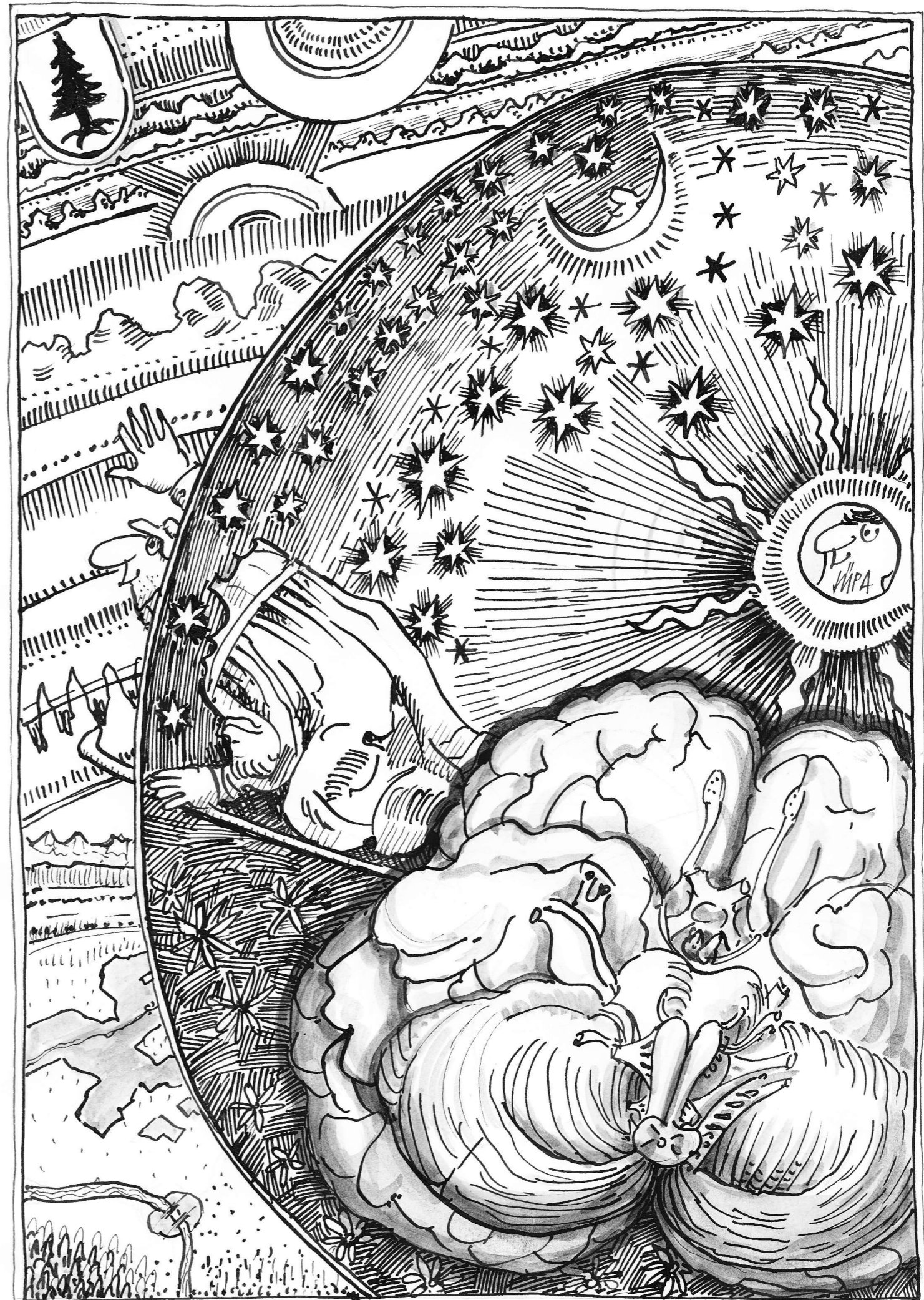
Der Weltuntergang stammte aus dem menschlichen Gehirn. (nach C.Flammarion)